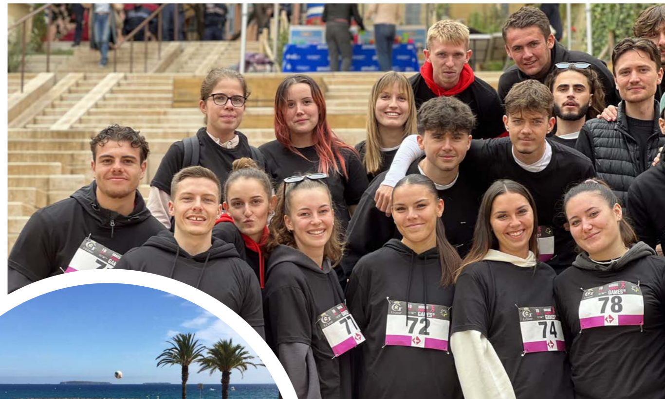
Grasse Campus Games (Challenge sportif étudiants)

DES PROJETS DES RENDEZ-VOUS DES EXPERIENCES DES RENCONTRES DES FETES DES ATELIERS DES EVENEMENTS DES FORUMS