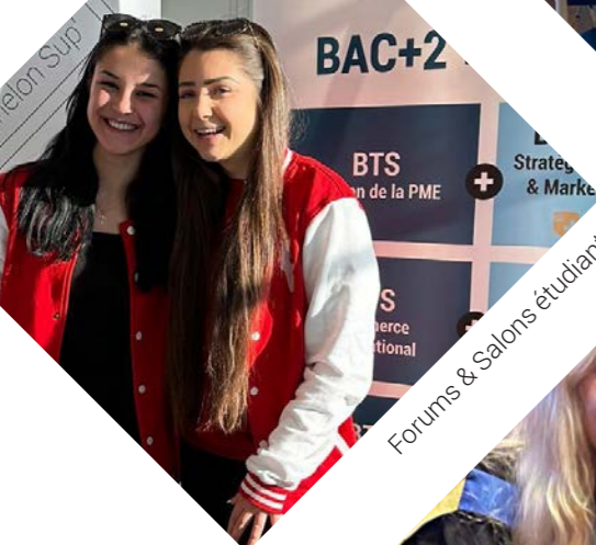
Forums & Salons étudiants