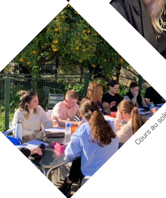
Cours au soleil