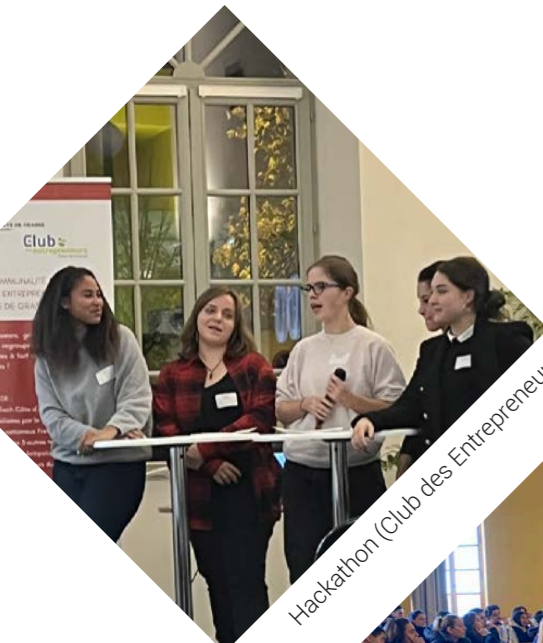
Hackathon (Club des Entrepreneurs)