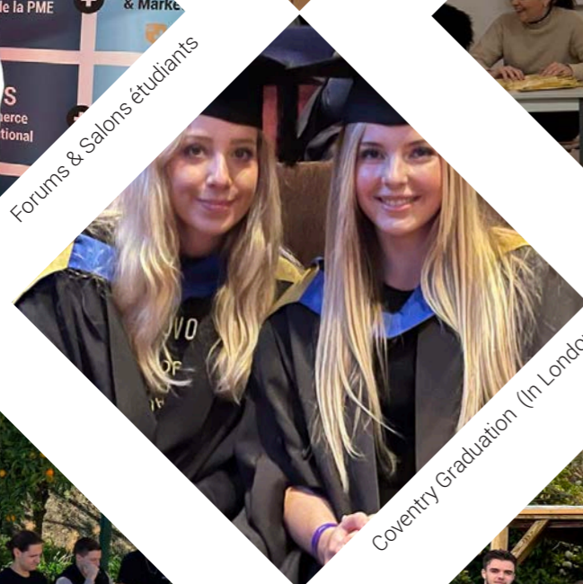
Coventry Graduation (In London)