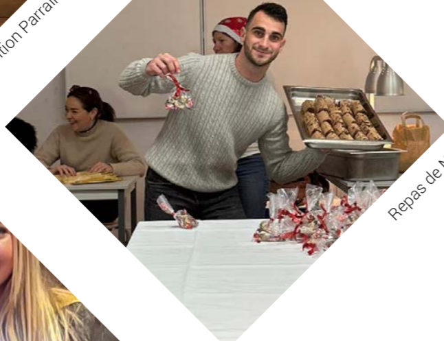
Repas de Noël